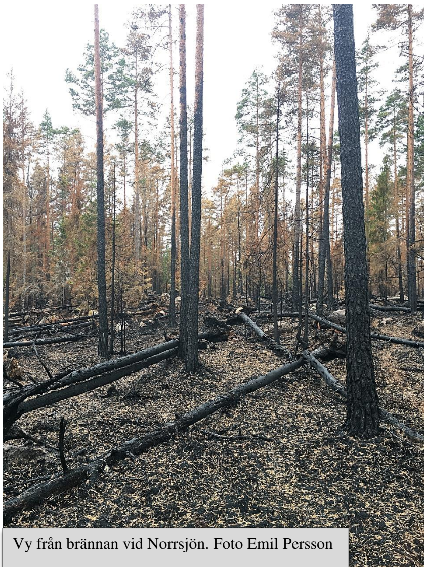
Vy från brännan vid Norrsjön.

Vandring i länets största naturreservat. Stocksmyr-Brännan är länets största naturreservat och tillsammans med det angränsande Storasjöområdet mäter det sammanlagda skyddade området nära 4 000 hektar! Området präglas av stora öppna myrmarker omgivna av tallskog. Skogarna har sedan urminnes tider dansats av bränder som skapat varma, ljusöppna skogar med ett rikt insektliv. Idag vårdar Länsstyrelsen området genom kontrollerade naturvårdsbränder och vi besöker ett sådant område som brändes sommaren 2017. Redan nu är brännan rik på död ved och fågel- och insektlivet blomstrar i den brända skogen.