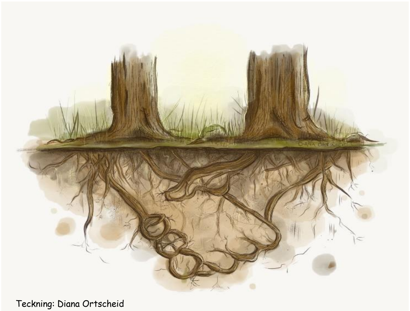
Teckning: Diana Ortscheid

I en frisk skog står nämligen träden i förbindelse med varandra. Genom rot-systemen pumpar friska träd över sockerlösning till sjuka och skadade träd, medan informationen om insektsangrepp och andra faror flödar genom ett underjordiskt nätverk av fina svamptrådar som knyter ihop hela skogen och som träffsäkert liknas vid internets glasfiberledningar.