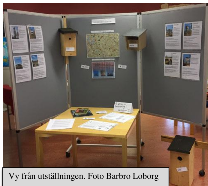
Vy från utställningen.

Den fanns även uppsatt i Norrhults Folkets Park när riksteatern gjorde besök med föreställningen ”Vi som bor här”.