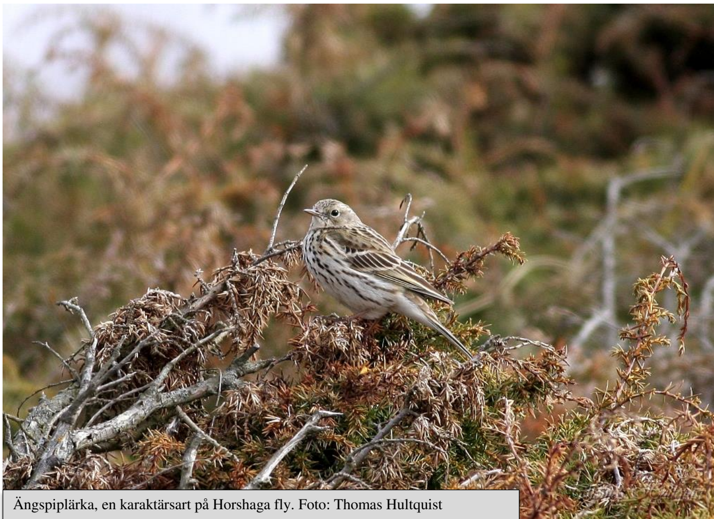
Ängspiplärka, en karaktärsart på Horshaga fly.

Orrspel på Horshaga fly. Detta har blivit en efterfrågad aktivitet och för tredje året i rad gör vi ett besök på flyet under det mest intensiva orrspelet. Utöver spelande orrar kan vi hoppas på bl a ljunpipare och skogssnäppa. Trastsången brukar ljuda från olika håll och varje år har det dykt upp någon oväntad art.