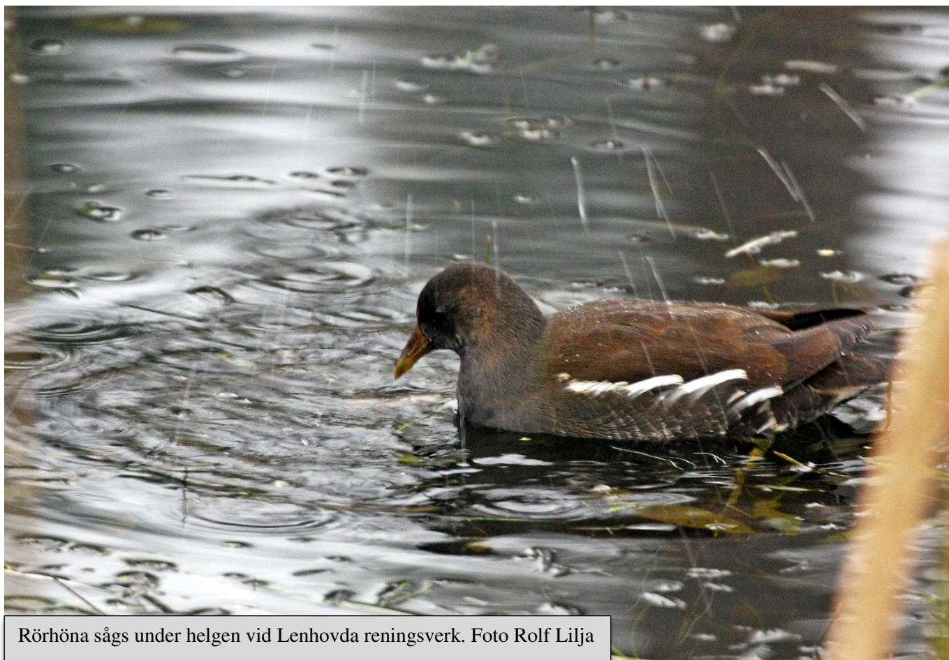
Rörhöna sågs under helgen vid Lenhovda reningsverk.

Totalt var det 20 fågelklubbar i Småland som deltog. Kalmar OF vinner i år Tigen och nu i överlägsen stil på hela 122 arter - vi lyfter på hatten och gratulerar till ett imponerande resultat! Tvåa blir Jönköpings FK med 113 arter och på tredje plats hittar vi Tjust OF. Mycket glädjande är också att detta evenemang växer i omfattning och i år hade vi sammantaget hela 315 skådare ute i fält under helgen. Därmed är rallyt i Småland ett av de allra största i hela landet.